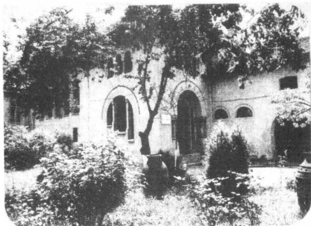
Ansamblul istoric Mihai Vodă.